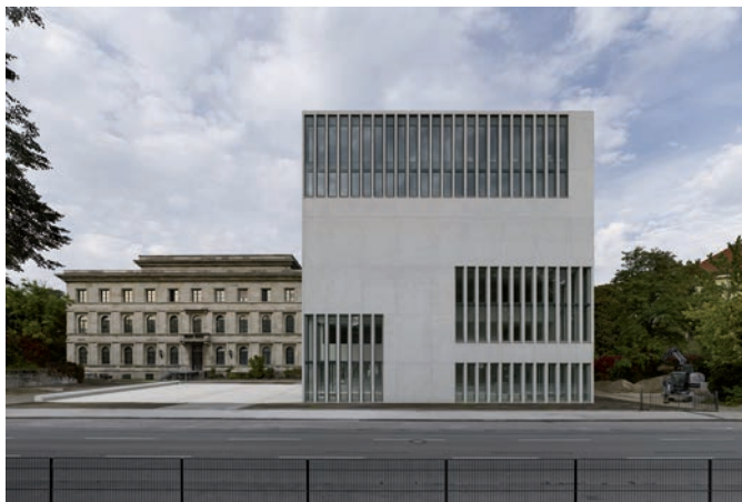
Bild 1 Die Fassade des NS-Dokumentationszentrums wurde aus Ort beton und Fertigteilen realisiert – beides auf Basis von Dyckerhoff WEISS.

Die Außenhaut des NS-Dokumentationszentrums besteht aus schalungsglattem, weißem Sichtbeton. Auffällig sind die überwiegend zweigeschossigen, mit senkrechten Betonlamellen ge-