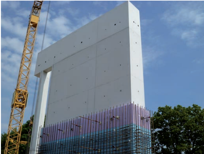
Bild 3 Erprobungsfläche in der Lindberghstraße: Innenschale – Wärmedämmung – Bewehrung der Außenschale

senhaft betoniert und verdichtet werden. Die Verbindungsteile der Innen- zur Außenschale mit der dazwischenliegenden Dämmebene aus druckfesten Hartschaumplatten wurden vom Ingenieurbüro Lammel, Lerch & Partner und der Firma Halfen entwickelt, um die Beweglichkeit der Außenschale zu ermöglichen (Bild 4).