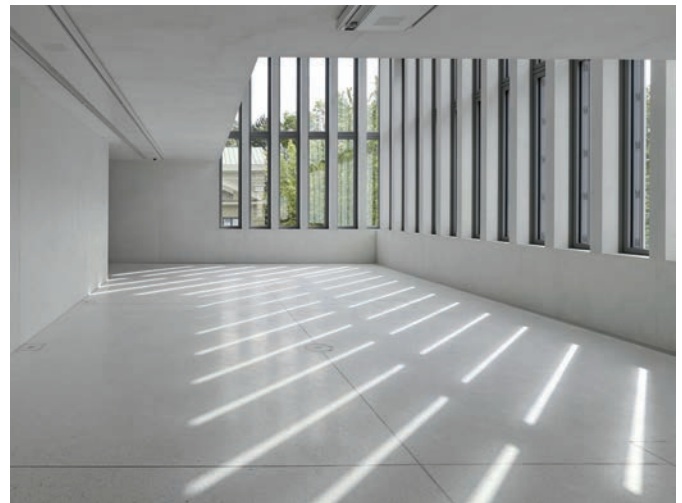
Bild 5 Die Firma Bayer Blaubeuren baute 2.500 m² Dyckerhoff TERRAPLAN-Betonböden ein.

wurden die Betonagen auf die frühen Morgenstunden verlegt. Es wurden weitreichende Laborprüfungen und hohe Standards für die Personalbesetzung festgelegt. Weiterhin wurde der Sichtbeton während der ersten drei Wochen nach Einbringung vor direktem Niederschlag und auch danach noch vor schroffen Temperatur- und Feuchtigkeitswechseln geschützt. Die scharfen Ecken und Kanten schützten die Verantwortlichen durch Folien, Auflagen und Verblendungen.