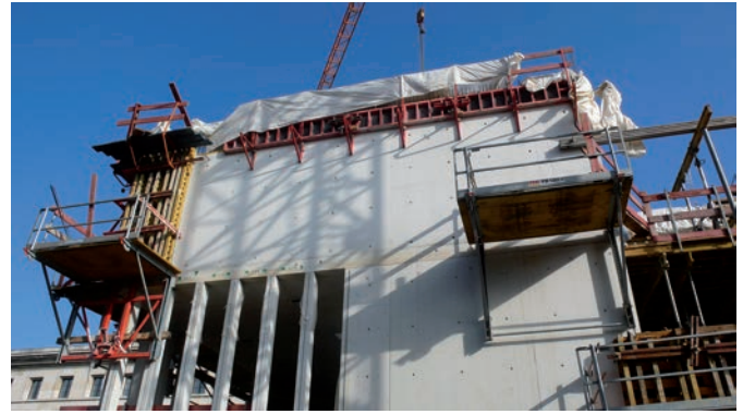
Bild 4 Betonage der Innenschale mit eingesetzten Fertigteilamellen

Zum Erreichen der hohen Anforderungen wurde ein Sichtbeton-Team aus allen relevanten Beteiligten gebildet (siehe Kasten). Für eine möglichst hohe Sichtbetonqualität wurde z. B. bei Frost komplett auf den Betoneinbau verzichtet. Dadurch wollte man die bei sehr niedrigen Temperaturen zu befürchtende Wolken- und Fleckenbildung vermeiden. Bei hohen Temperaturen